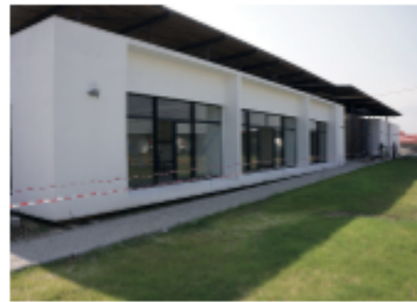
Etat des travaux de la Maison d'Alice