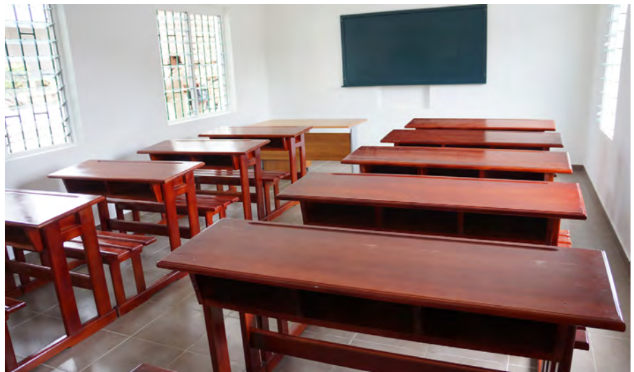
Salle de classe rénovée et équipée à la prison de Libreville.

Toutes ces activités participent au processus de reconstruction de ces jeunes en conflit avec la loi qui, dans une dignité retrouvée, tiendront leur place au sein de la société.