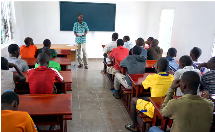
Un cours dispensé aux jeunes mineurs incarcérés.

«Dehors je n'allais pas à l'école, ici avec les éducateurs on apprend beaucoup. Ça me plaît.»