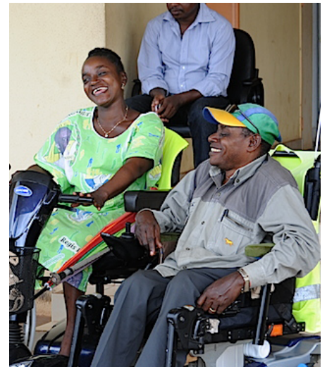
Bénéficiaires du programme Solidarité Handicap.

Depuis sa création, la Fondation SBO pour la Famille soutient avec une attention particulière les populations fragilisées et en grande précarité, notamment les personnes vivant avec un handicap moteur. Au sein de nos Initiatives pour la Solidarité, en accompagnement des Pouvoirs publics, nous œuvrons pour que leurs conditions de vie et d'insertion sociale s'améliorent de jour en jour dans notre pays.