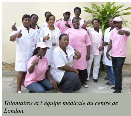
Volontaires et l'équipe médicale du centre de London.

C'est également en rose que la Fondation SBO a décidé de commencer ce joli mois d'octobre en mettant à l'honneur les Gabonaises, socles de la cellule familiale et de notre nation : du 06 au 31 octobre dernier, la première édition gabonaise « d'Octobre Rose » s'est transformée en une grande campagne de sensibilisation pour le dépistage précoce des cancers féminins sous le slogan « Les cancers féminins, parlez-en aux femmes que vous aimez ! ».