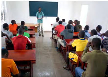
Cours dans une salle de classe renouvée.

Nous avons voulu les encourager et c'est dans deux salles de classe refaites à neuf et entièrement équipées que nos jeunes apprenants ont débuté leur année.